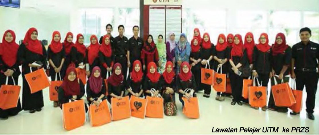
Lawatan Pelajar UiTM ke PRZS