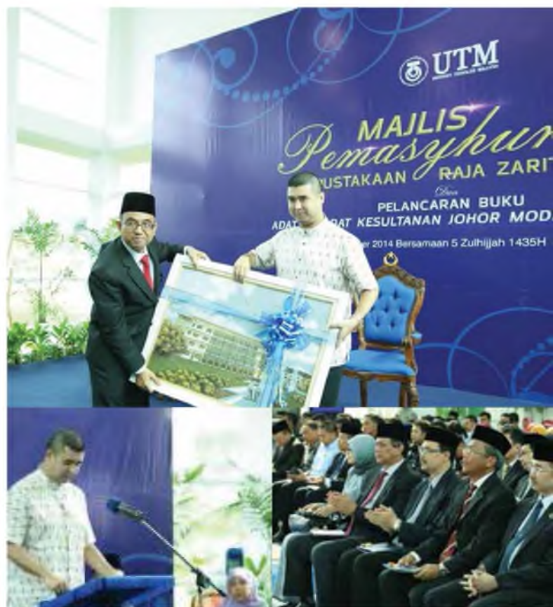
[ Lagi gambar menarik di ms 4&5 ]