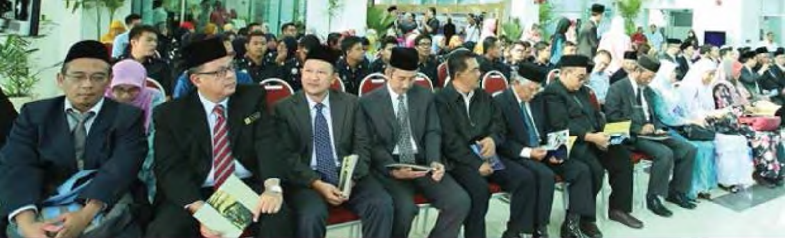
SEKITAR MAJLIS PEMASYHURAN PERPUSTAKAAN RAJA ZARITH SOFIAH