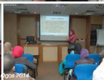
Lawatan dari perpustakaan Universiti Sains Islam Malaysia (USIM) Pada 27 Ogos 2014