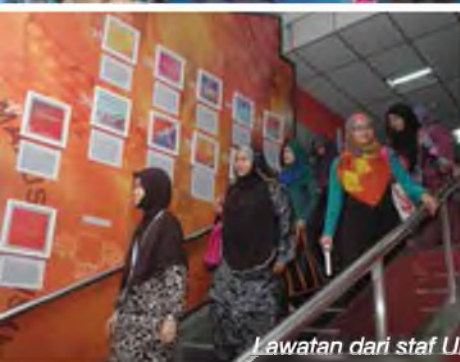
Lawatan dari staf UMIMAP - 25 Jun