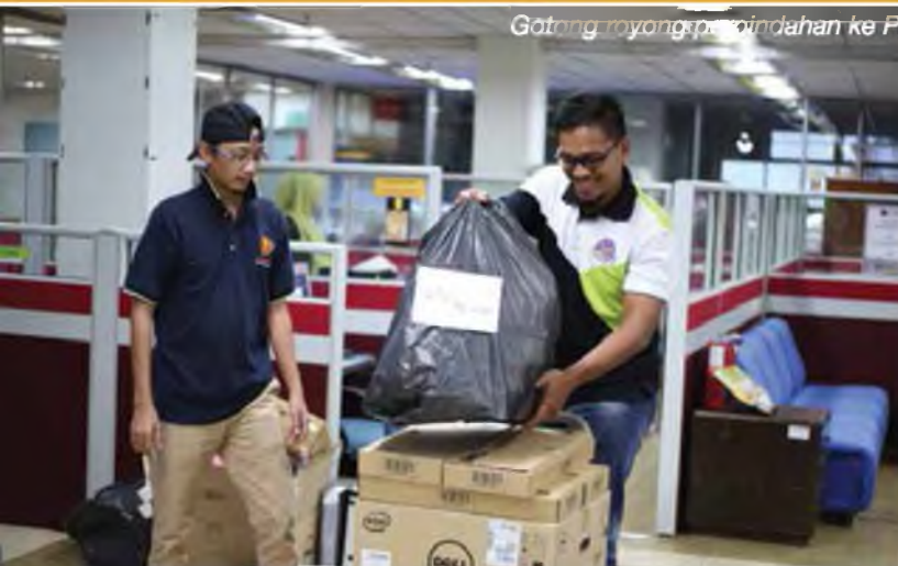
Gotong royong berpindahan ke PZZS - 15 September