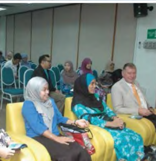
Program K-Sharing - 28 Ogos