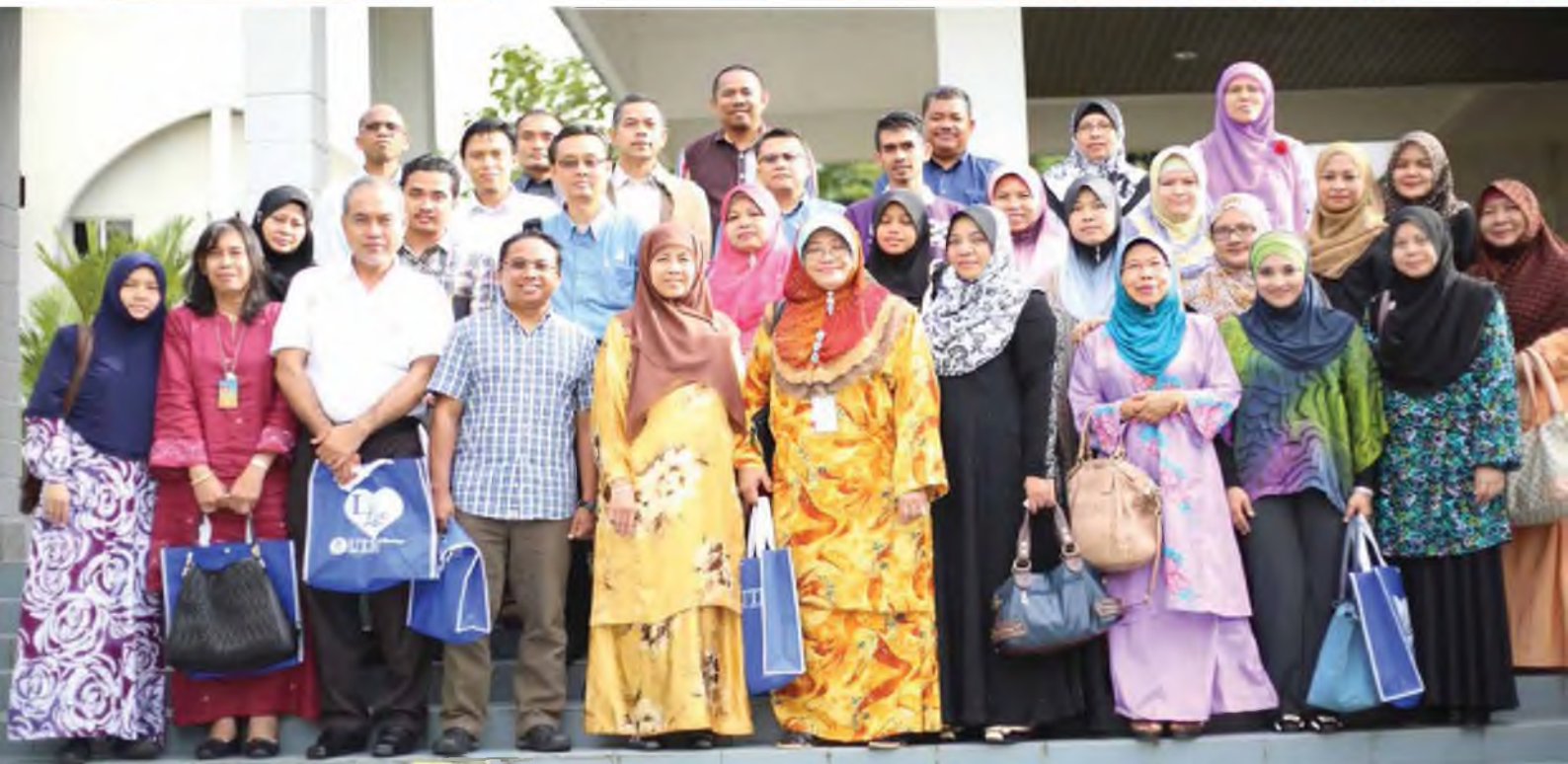
Lawatan Pensyarah UiTM—6 September