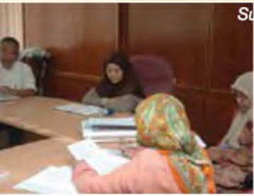
Surveillance Audit oleh pihak SIRIM 23-24 Jun