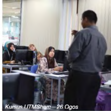
Kursus ITMShera—26 Ogos