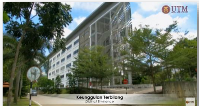
Video Keunggulan Terbilang, siap pada 22 Oktober 2016