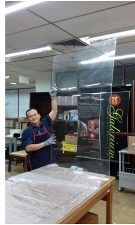
Hasil akhir olahan akrilik

Menyedari kekangan kewangan perlu dihadapi dengan bijak, Unit Konservasi Galerium mengambil inisiatif menggunakan sumber sedia ada dan diolah semula agar bermanfaat untuk aktiviti pameran. Poster merupakan medium yang lazim digunakan dalam pameran. Penggayaan poster lebih menarik jika ia dibingkaikan agar kelihatan kemas dan selamat pada tempatnya. Bak kata pepatah Melayu 'tiada rotan, akar pun berguna juga' , bermula Mac 2017 Unit Konservasi menjalankan gerak kerja mengolah semula kepingan akrilik pelbagai saiz bagi tujuan mempamer poster tanpa bingkai di dalam pameran yang di adakan dari masa ke semasa. Hasil akhir sungguh memuaskan dan aktiviti bakal diteruskan dari masa ke semasa.