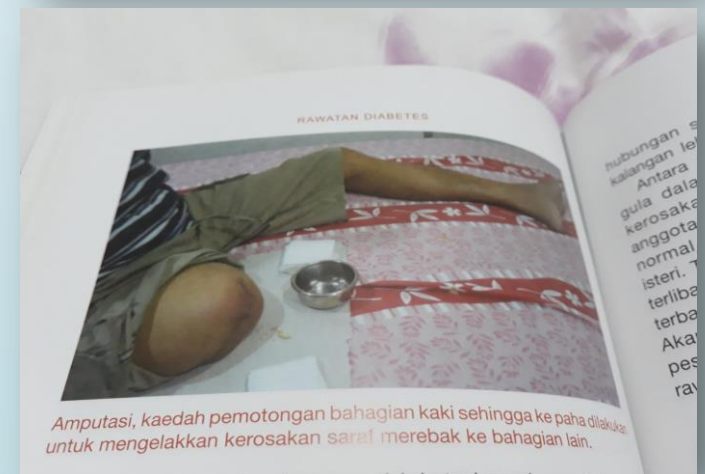
Amputasi, kaedah pembedahan bahagian kaki sehingga ke paha dilakukan untuk mengelakkan kerosakan saraf merebak ke bahagian lain.